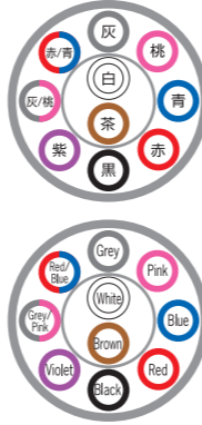
例)10芯 ex) 10c