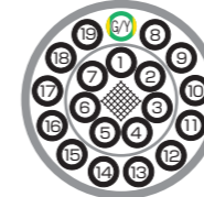
色比率 Color ratio G/Y (G:Y=6:4)