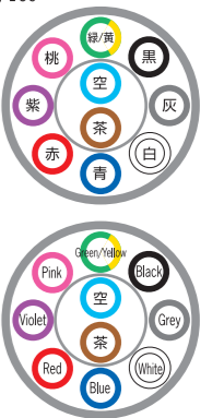
例)10芯 ex) 10c

※3c以上は緑/黄が含まれます。 ※Green/Yellow is contained at 3cores and more.