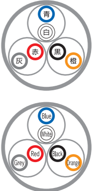
例)3対 ex) 3P