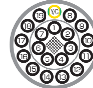
色比率 Color ratio Y/G (Y:G=6:4)