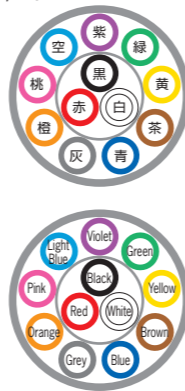
例) 12芯 ex) 12c