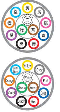
例)12芯 ex) 12c