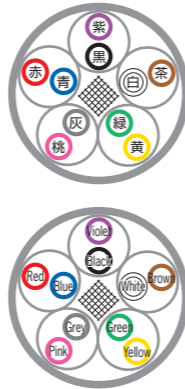
例) 5対 ex) 5P