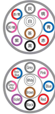
例)10芯 ex) 10c