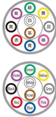
例)10芯 ex) 10c