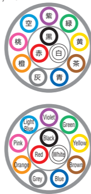
例) 12芯 ex) 12c