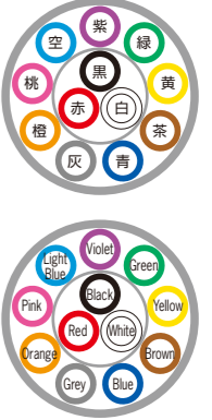
例)12芯 ex) 12c