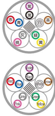
例)5対 ex) 5P