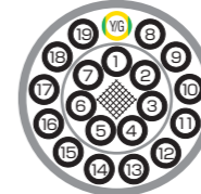
色比率 Color ratio Y/G (Y:G=6:4)