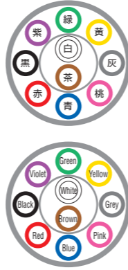
例) 10芯 ex) 10c