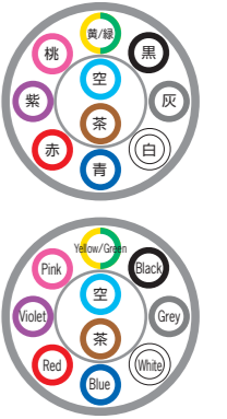
例)10芯 ex) 10c