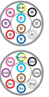
例)10芯 ex) 10c

※3c以上は緑/黄が含まれます。 ※Green/Yellow is contained at 3cores and more.