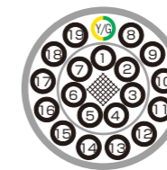
例)20芯(黄/緑) ex) 20c (Yellow/Green)