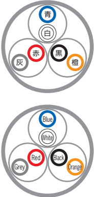
例)3対 ex) 3P