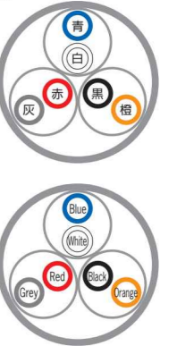
例)3対 ex) 3P