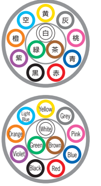
例)12芯 ex) 12c