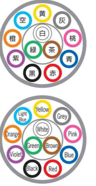
例)12芯 ex) 12c